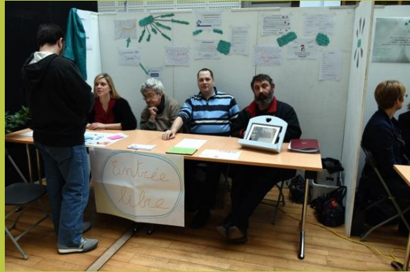
« Club psychosocial »