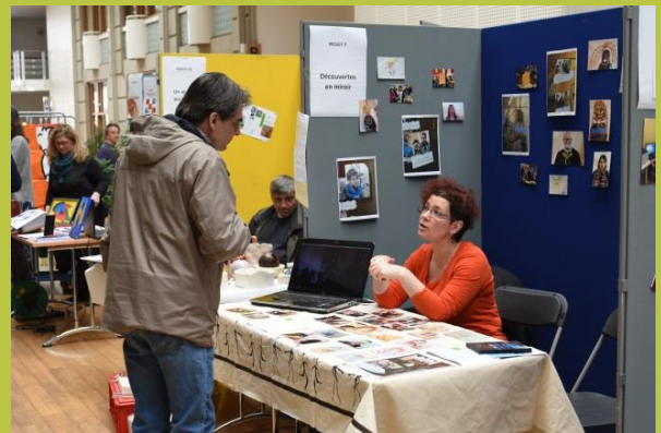
« Découvertes en miroir »