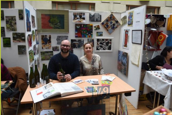
« EC (RIRE) »