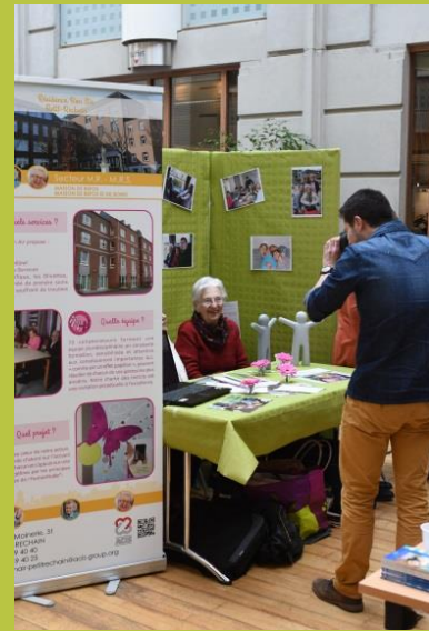
« Ensemble c'est tout... »