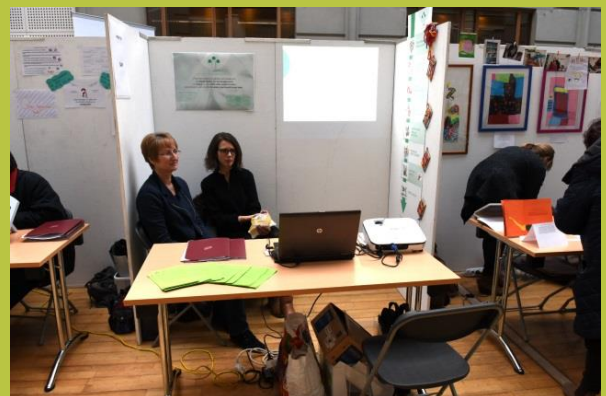
« SAPI » Service d'aide aux Personnes avec difficultés Intellectuelles