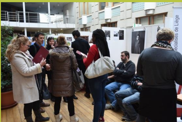
« Enquête d'identité(s) – Atelier d'écriture et de photographie »