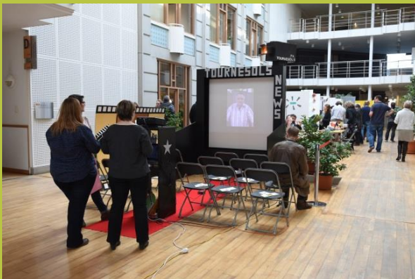
« Tournesols News »