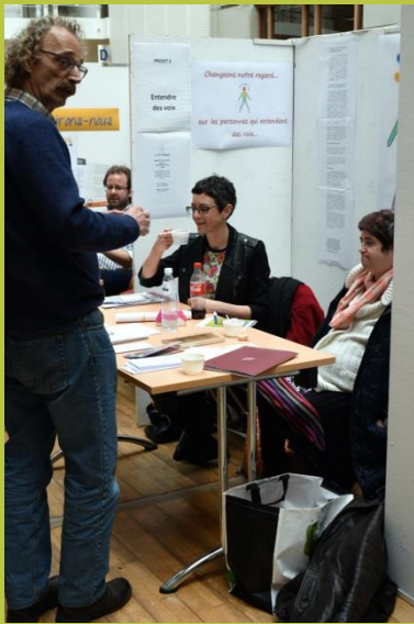
« Changeons notre regard sur Les personnes qui entendent des voix »