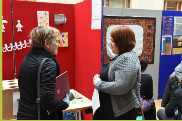
« Club thérapeutique : la transhumance »