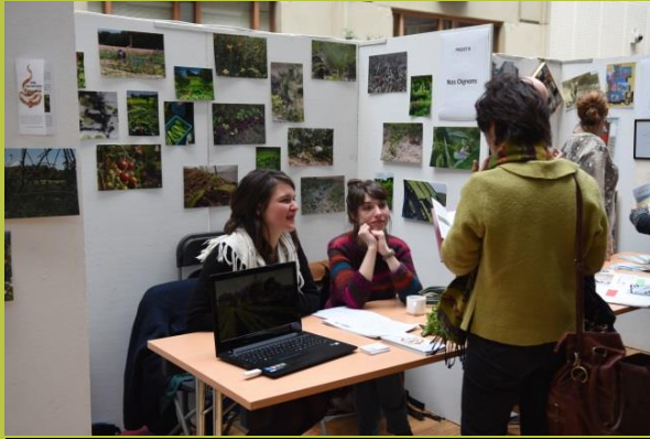
« Développement d'accueil collectif et individuel en entreprises agricoles pour les bénéficiaires des institutions de soins en santé mentale actif en Brabant wallon »