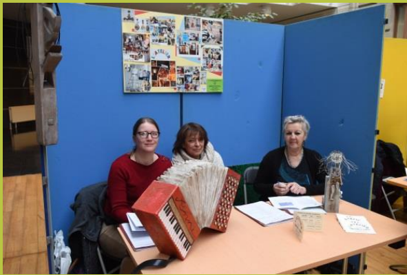
« L'Atelier », Maison médicale « Le Gué », à Tournai, Prix du Jury

Les lauréats 2014 sont aussi au rendez-vous.