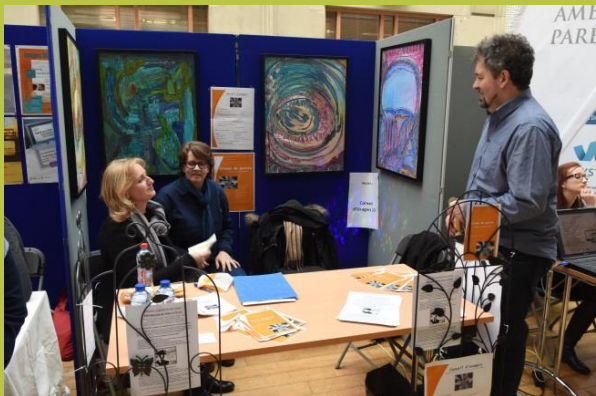
« Conseil d'Usagers du projet 107 - Région Hainaut »