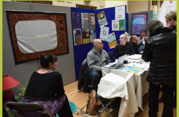
« Rencontres Images Mentales »