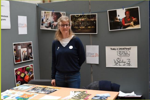
« Alter MEDIALAB Migrants »