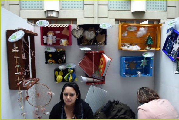
« Le Millepattes éco-créatif »