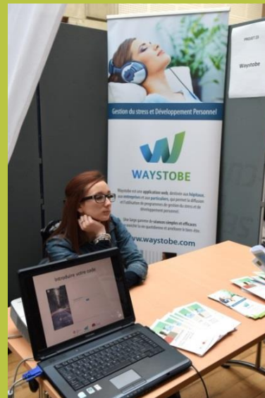
« Utilisation de l'application « Waystobe »