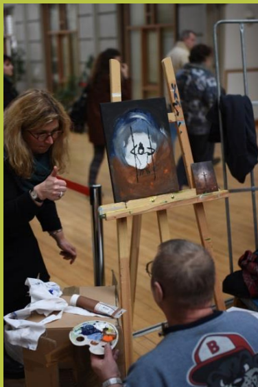
Projet HAPI (Handicap Patients Internés) » comme outil éducatif »