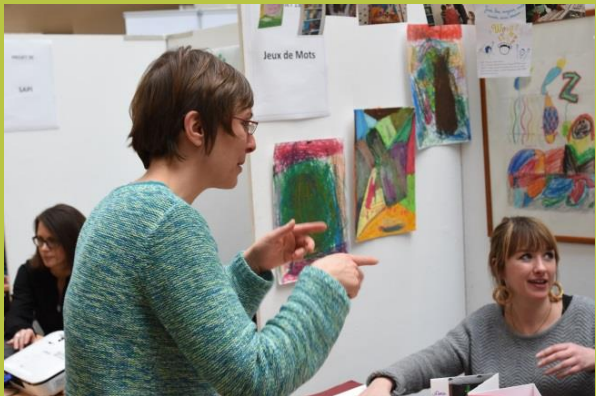
« Jeux de Mots ... »