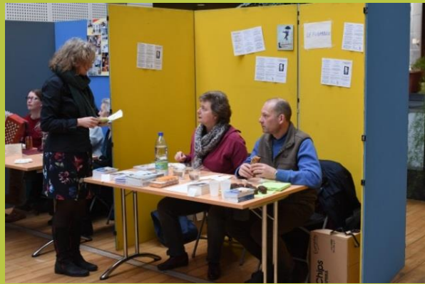
« Le trouble bipolaire, parlons-en ! », asbl « Le Funambule à Bruxelles (Jette), Prix du Public