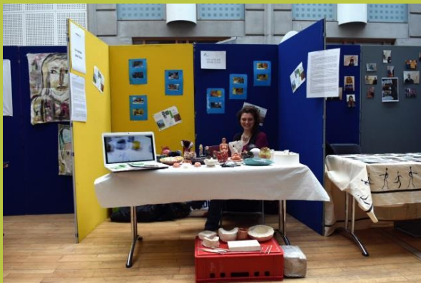
« Un atelier pour tous »