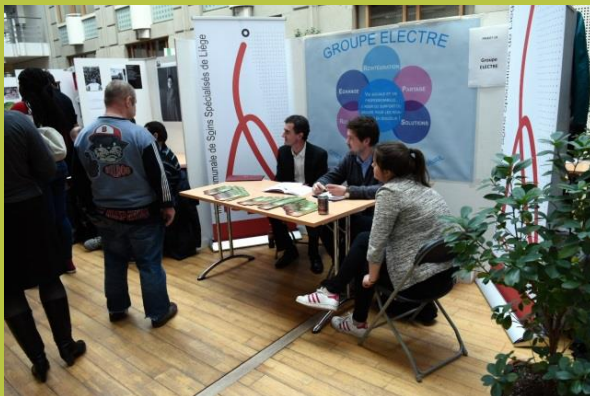
« Groupe ELECTRE : Vie sociale et vie professionnelles, s'aider du support du groupe pour les réintégrer en douceur ! »