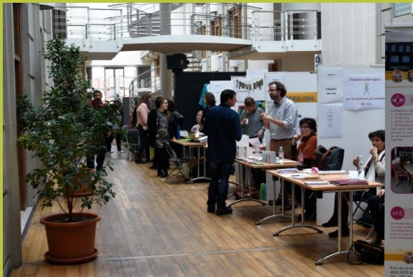
« Eclairons-nous »