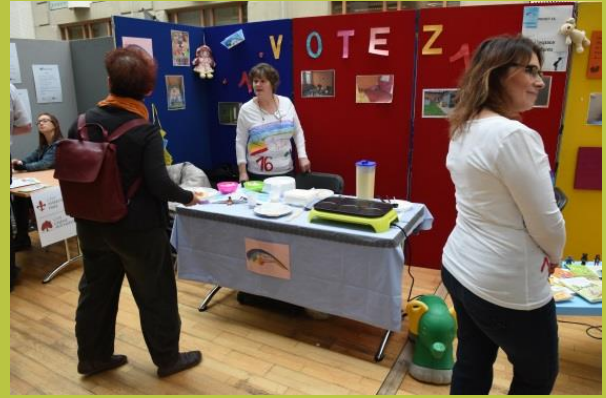
« L'espace enfants vous accueille »