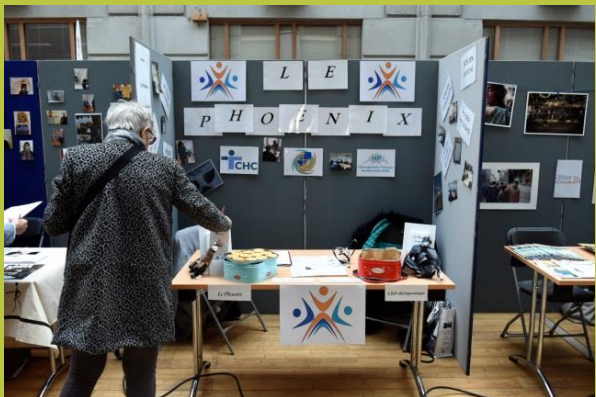
« Club thérapeutique : Le Phoenix »